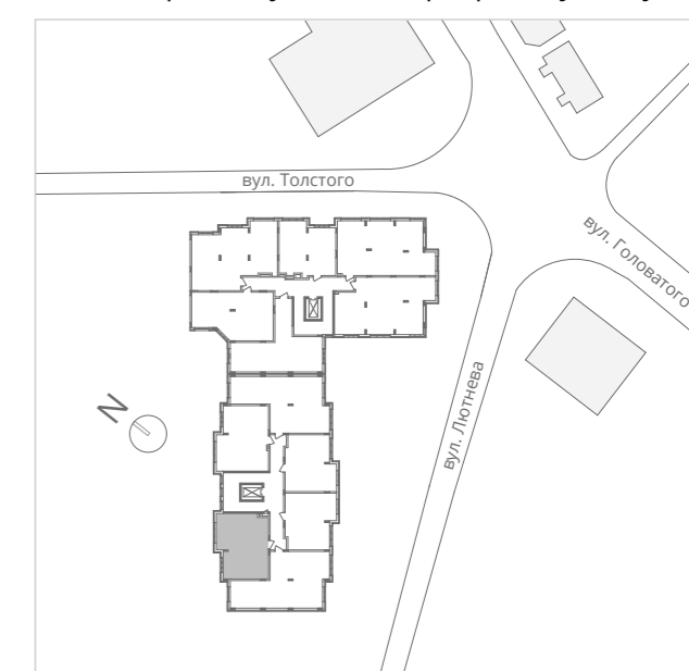
■ Схема розташування квартири в будинку.